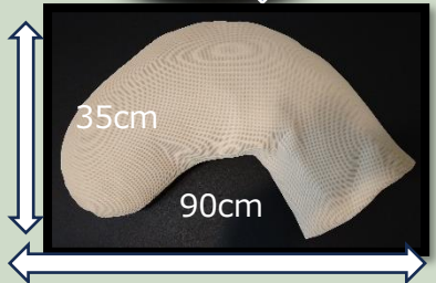
仰向けで足を乗せても気持ちがいい 万能タイプ ばなな 8,000 円