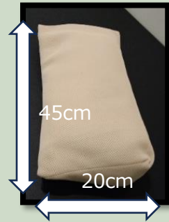
くさび 3,500 円